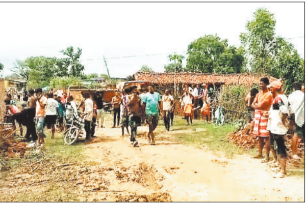
गांव में लगी ग्रामीणों की भीड़।