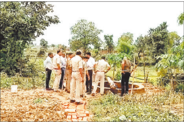
घटना स्थल का मुआयना करती पुलिस।