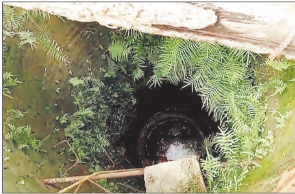
वह कुआ जहां हुआ हादसा।