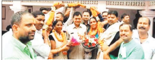
उद्योग मंत्री का स्वागत करते भाजपा कार्यकर्ता।