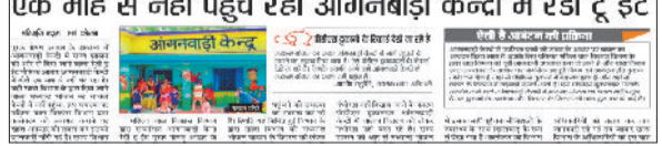
हरिभूमि में प्रकाशित खबर का कतरन।

लेकर मध्याह्न भोजन चलाए जाने के मामले को लेकर कलेक्टर ने हरिभूमि अखबार में प्रकाशित खबर को संज्ञान में लेकर तीन सदस्यीय जांच टीम गठित की है, जो तीन दिन में जांच रिपोर्ट कलेक्टर को सौंपेगी।