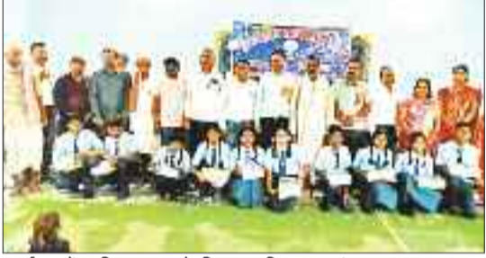
कार्यक्रम में उपस्थित स्कूल के शिक्षक अभिभावक एवं छात्र।